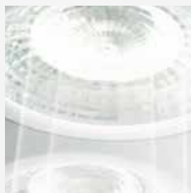
Однородное световое поле