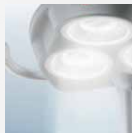
Надежное и точное позиционирование