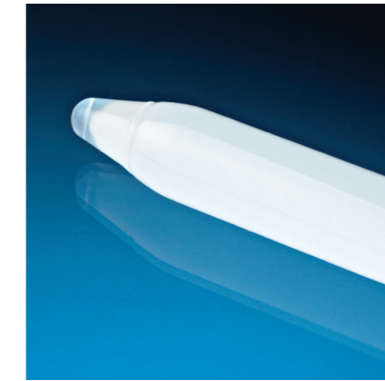
Мягкие моделирующие апексы цилиндров анатомической формы.