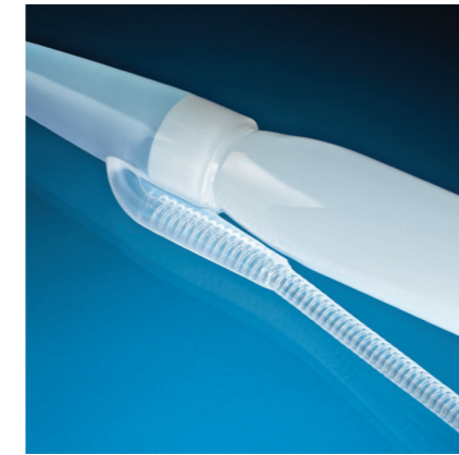
Zero Degree Angle угол отхождения трубочек 0° позволяет использовать имплант большего размера с меньшим количеством колпачков-экстендеров.