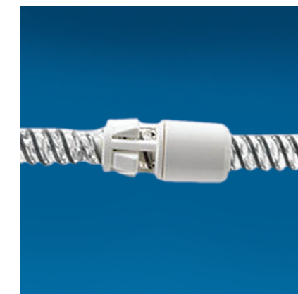
True-Lock® соединение: легкая и быстрая сборка без дополнительного инструментария и без риска утечки.