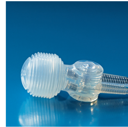
Titan Touch Pump помпа нового поколения.